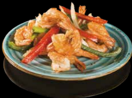
63 GAMBERI* CON SALE E PEPE E CIPOLLE