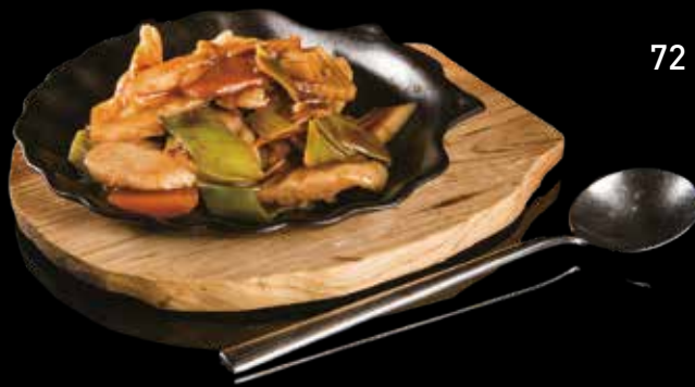
72 POLLO ALLA PIASTRA CON VERDURE Pollo con bambù, carote, porro