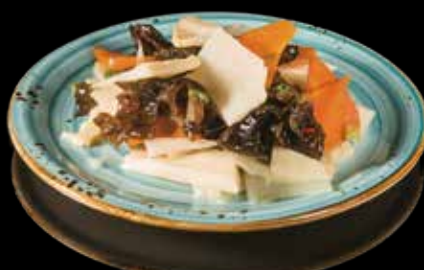
95 BAMBU E FUNGHI

Funghi neri, bambù, carote, erba cipollina