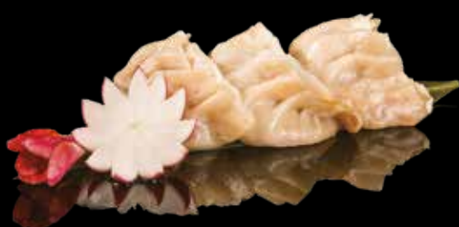
3 RAVIOLI DI CARNE AL VAPORE 3pz Ravioli di carne* di suino