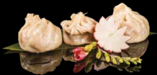
4 RAVIOLI DI VERDURE AL VAPORE 3pz Ravioli di verdure miste*