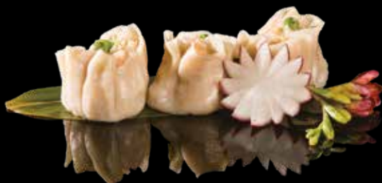
5 SHAO MAI 3pz Ravioli di shao mai con pollo* e pesce