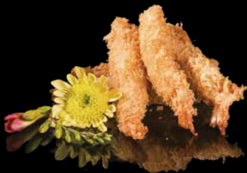
58 TEMPURA DI GAMBERONI*