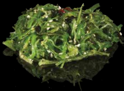
10 WAKAME Alghe giapponese