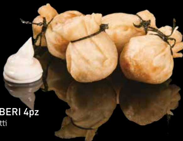
13 SACCOTTINI DI GAMBERI 4pz Saccottini di gamberi* fritti