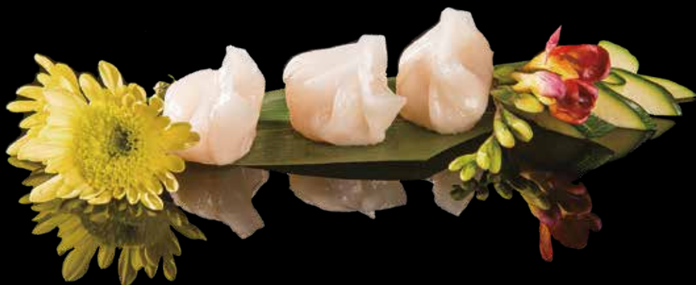
9 RAVIOLI DI GAMBERI 3pz Ravioli di gamberi* al vapore