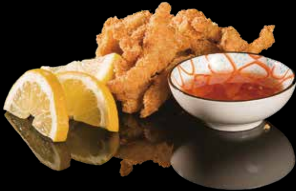
70 FILETTO DI POLLO STILE GIAPPONESE Bocconcini di pollo* fritto