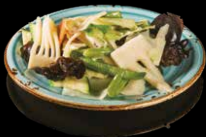
91 VERDURE MISTE SALTATE

Bambù, fagioli*, funghi neri, zucchine, carote, erba cipollina