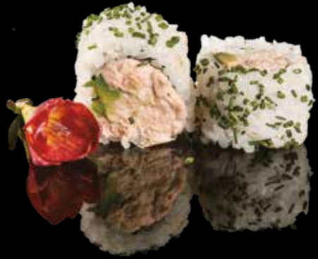
127 ROLL TONNO COTTO Roll di riso con tonno cotto, avocado, erba cipollina