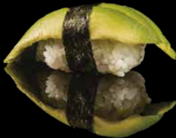
104 NIGIRI AVOCADO