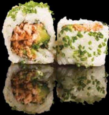
124 ROLL SALMONE COTTO Roll di riso con salmone cotto, avocado, erba cipollina