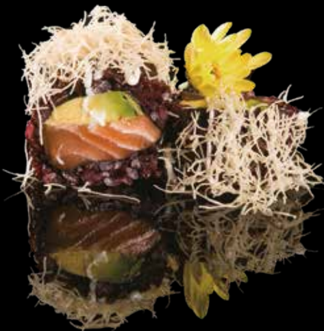
126 ROLL VENERE SALMONE Roll di riso venere con salmone, avocado, guarniti con pasta kataifi, salsa maionese