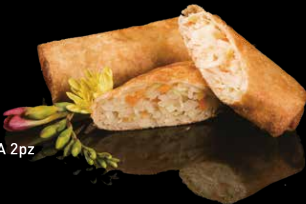
1 INVOLTINI PRIMAVERA 2pz Verdure