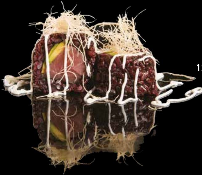
125 ROLL VENERE TONNO Roll di riso venere con tonno, avocado, guarniti con pasta kataifi, salsa maionese