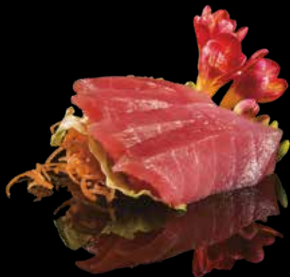
★ 154 SASHIMI MAGURO 6pz Tonno