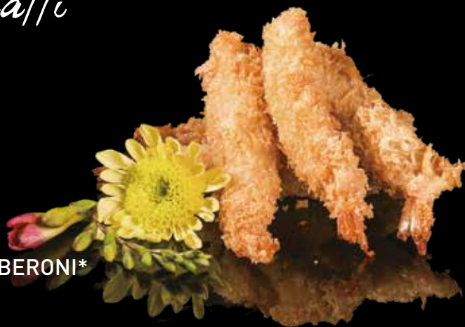
58 TEMPURA DI GAMBERONI*