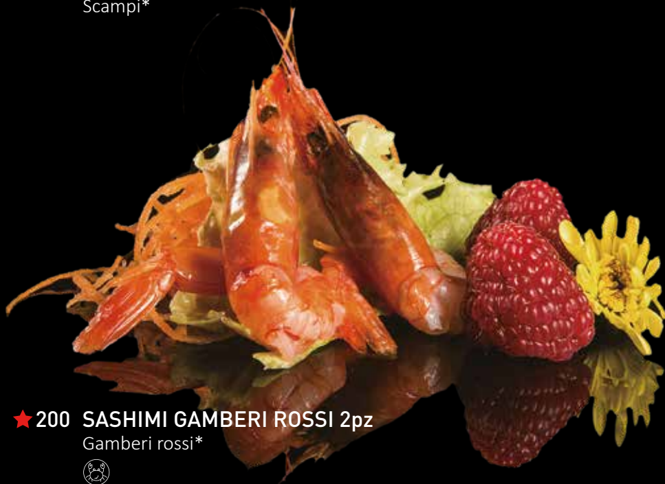
★ 200 SASHIMI GAMBERI ROSSI 2pz Gamberi rossi*