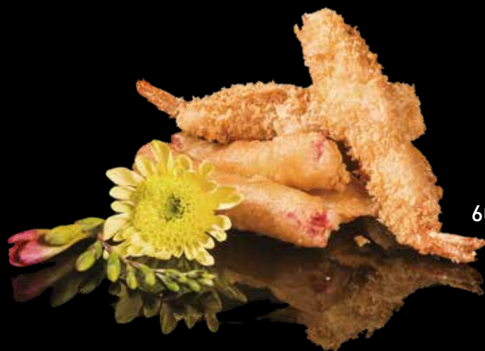
60 TEMPURA MISTO DI MARE

Gamberoni*, calamari*, surimi di granchio*