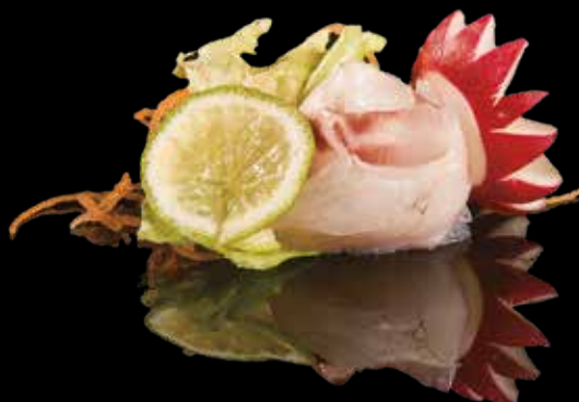
★ 201 SASHIMI SCAMPI 2pz Scampi*