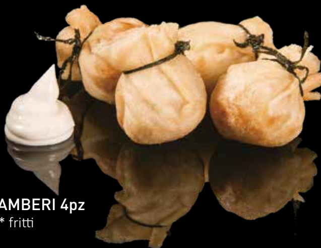
13 SACCOTTINI DI GAMBERI 4pz Saccottini di gamberi* fritti