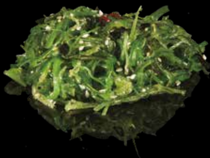
10 WAKAME Alghes giapponeses