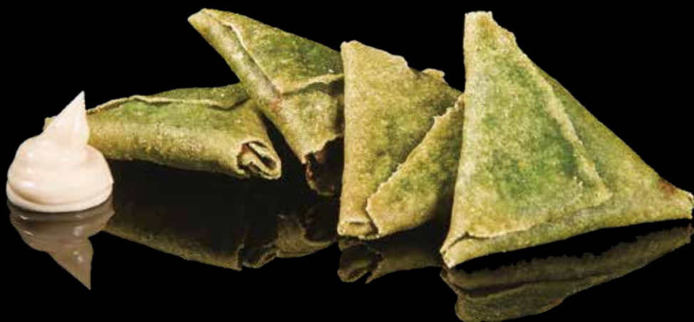
12 SFOGLIA DI SPINACI CON VERDURE 4pz SfoGLIA di spinaci con verdure