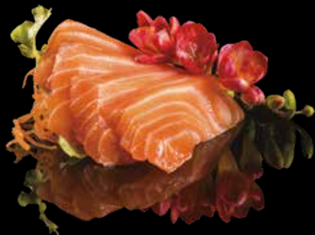
★ 155 SASHIMI SHAKE 6pz Salmone