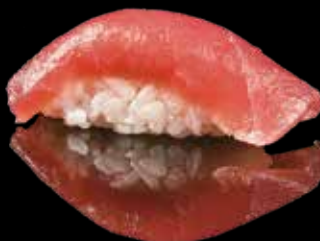
100 NIGIRI MAGURO Tonno