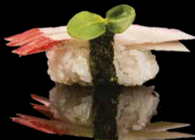
102 NIGIRI KANI Surimi di granchio*