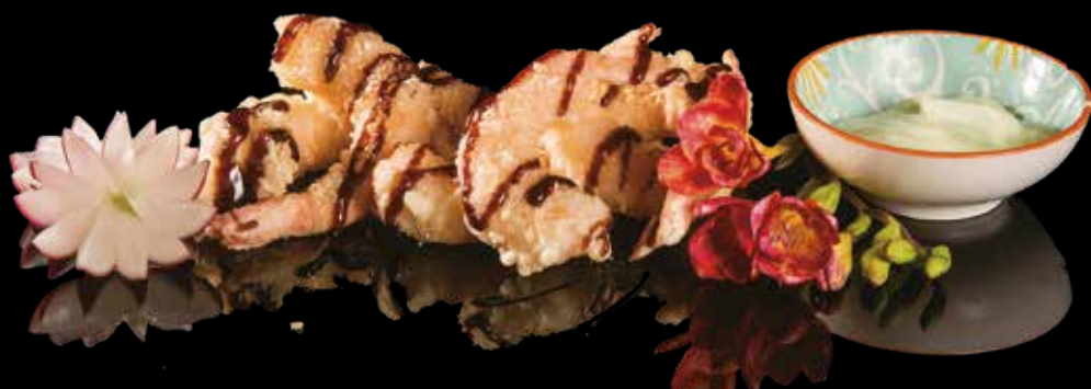
57 BOCCONCINI DI GAMBERONI CON SALSA SPECIALE Gamberoni* fritti, salsa speciale, salsa piccante