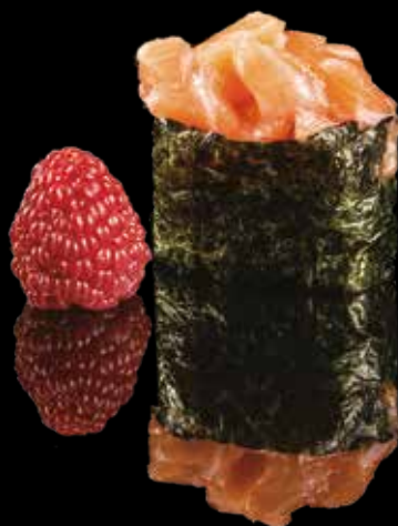
113 GUNKAN CON TARTAR DI SALMONE Bocconcino di riso con alga nori, tartare di salmone