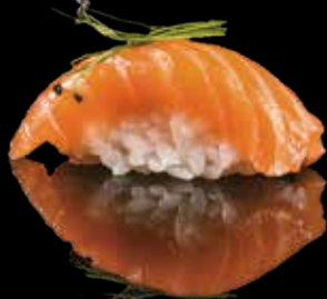
99 NIGIRI SHAKE Salmone