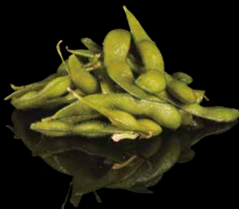
11 EDAMAME Fagiolis di soia al vapore*