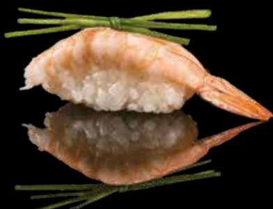
103 NIGIRI EBI Gamberi cotti*