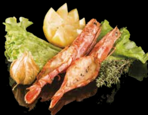
63 GAMBERI* CON SALE E PEPE E CIPOLLE