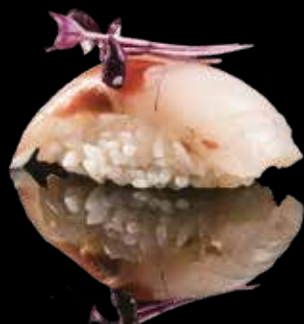
101 NIGIRI SUZUKI Branzino