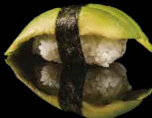
104 NIGIRI AVOCADO