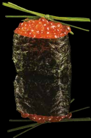
112 GUNKAN CON CAVIALE DI SALMONE Bocconcino di riso con alga nori, uova di pesce volante*